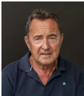
JÜRGEN RUDIGIER STADIONZEITUNG | HOMEPAGE