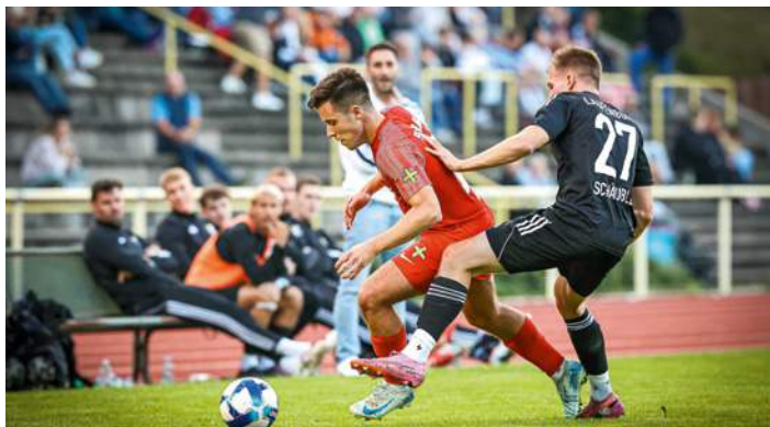
Foto aus dem Archiv - Pokal-Achtelfinale